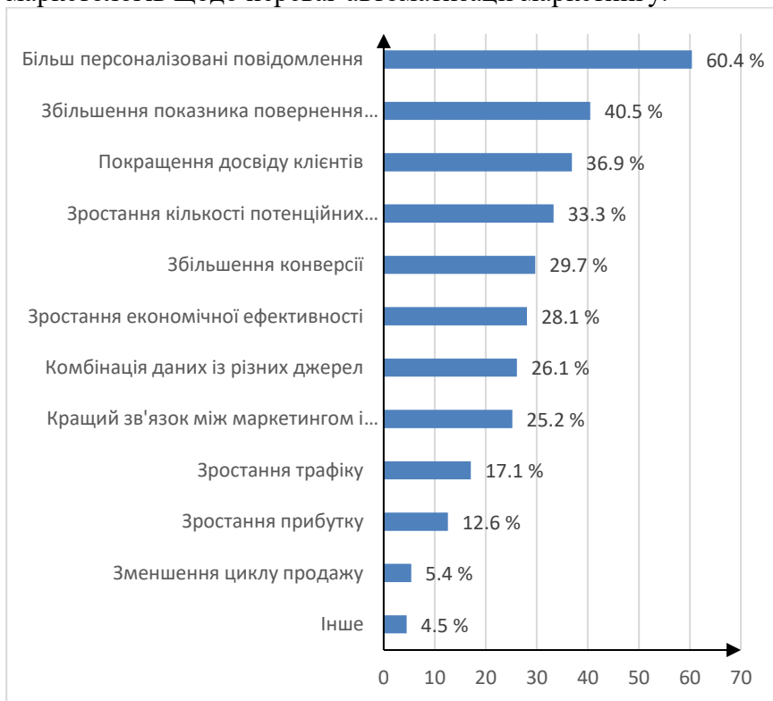
Рис. 1. Діаграма результатів опитування маркетологів щодо переваг автоматизації маркетингу

На рис. 1 представлено діаграму результатів опитування маркетологів щодо переваг автоматизації маркетингу.